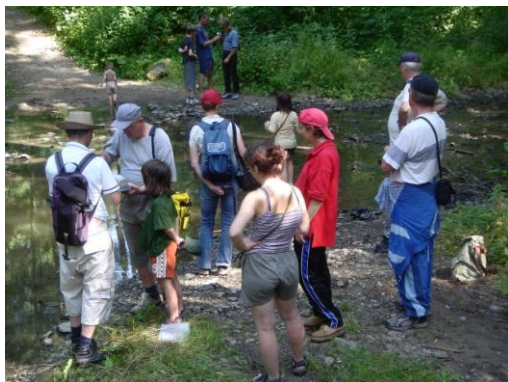
Údolí Plenkovického potoka