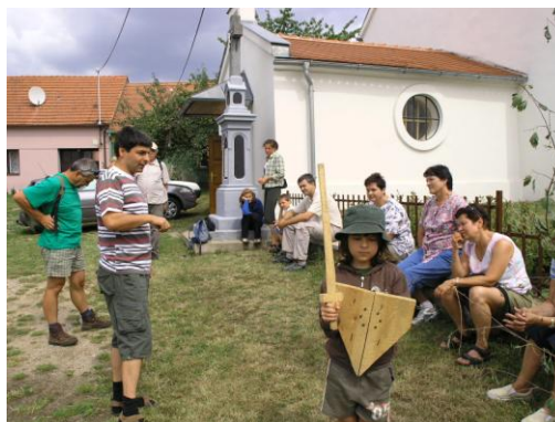
zahájení botanického odpoledne v Jamolicích

V dubnu 2007 a 2008 jsme se zúčastnily se stánkem Ekoporadny Dne země na náměstí v Moravském Krumlově ve spolupráci s Domem dětí a mládeže.