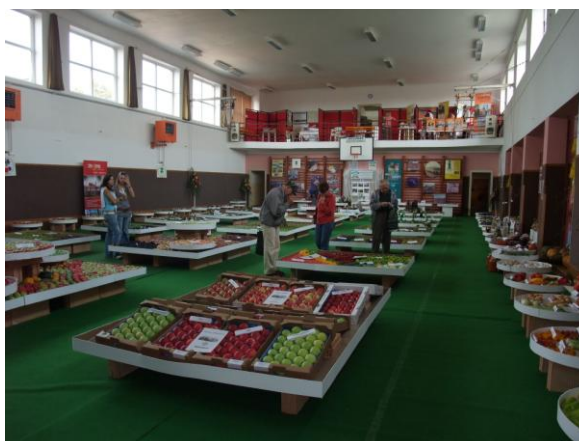
Znojensko - Zahrada Moravy, 11.-13. 9. 2009